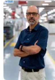
ANTONIO LÓPEZ GARCÍA