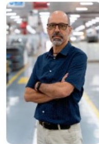
ANTONIO LÓPEZ GARCÍA